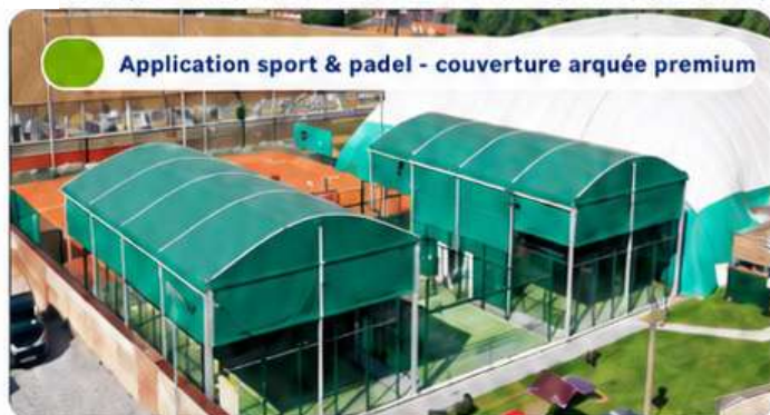
Application sport & padel - couverture arquée premium

Tente arquée aluminium 12 x 22 x 6 m - synthèse technique